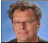
MEESTER THEO - directeur dhr. M.T. Hofstra